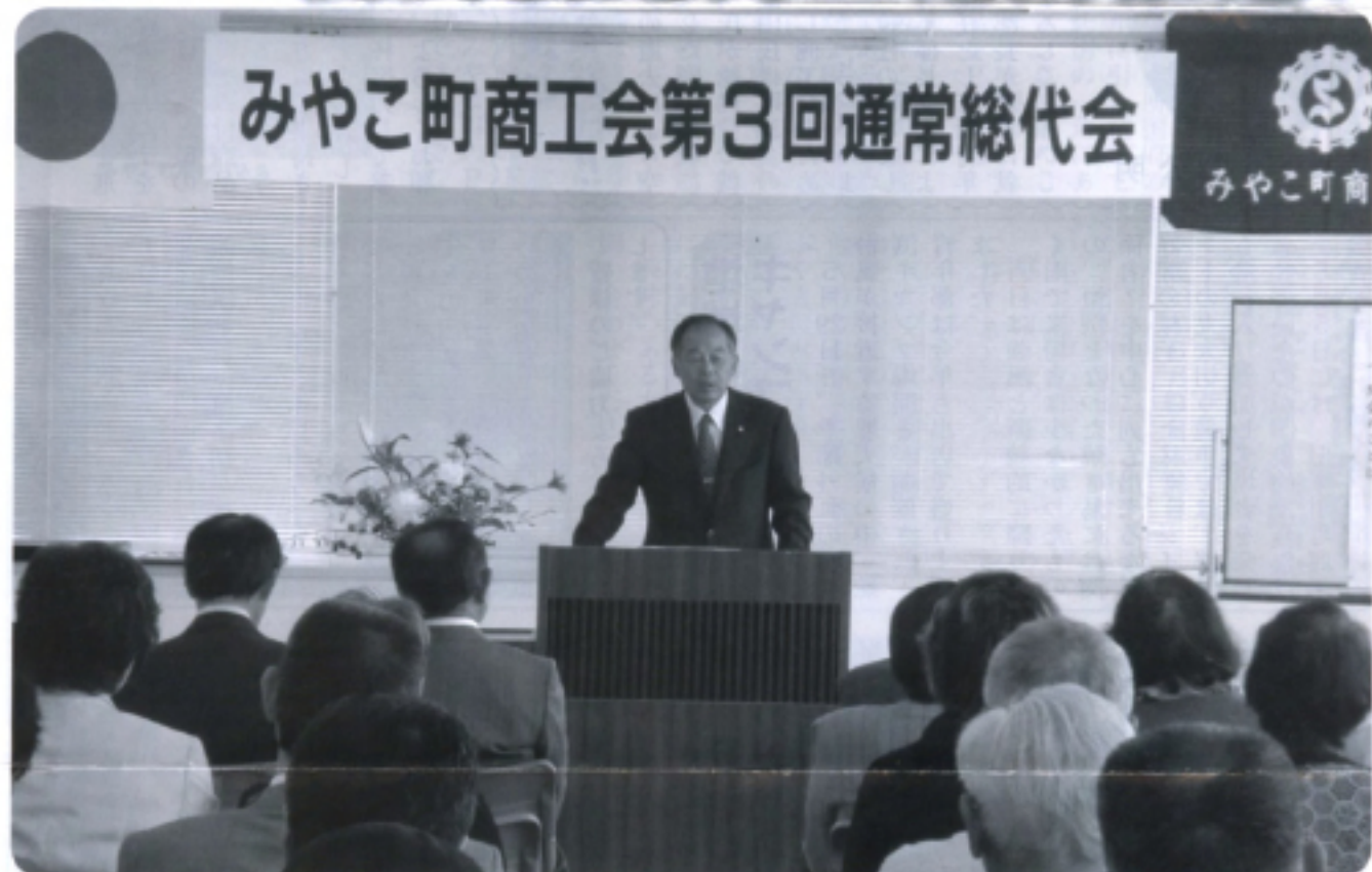
みやこ町商工会第3回通常総代会