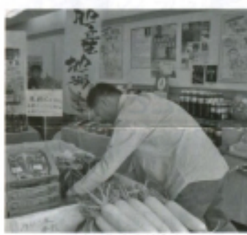
みやこ町を売り込め

平成23年度もプレミアム付商品券 売出します 平成23年度第1回目発行 発売日 平成23年7月3日(日) 発行総額 3,300万円 (3,000冊) このプレミアム付商品券は今年で3年目で地域住民に支持され、地域経済の活性化に大いに貢献できているものと思われまます。