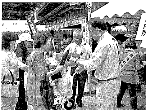
あじさい無料配布大好評

今年度より町のイベントが実行委員会形式でスタートしました。町の予算等の面で制約があるとは思いますが、明確なビジョンのもと町の観光振興をより効果的に進めていくため、官民あげて連携を深めていく必要があるように思います。