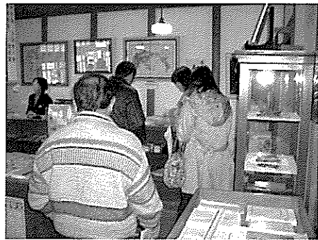
みすゞ記念館にて