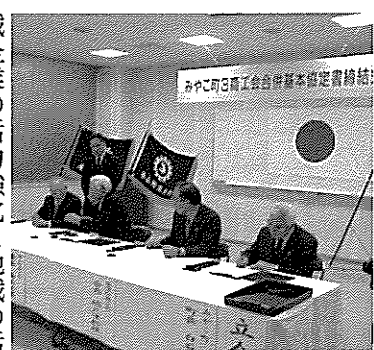
式 印 調