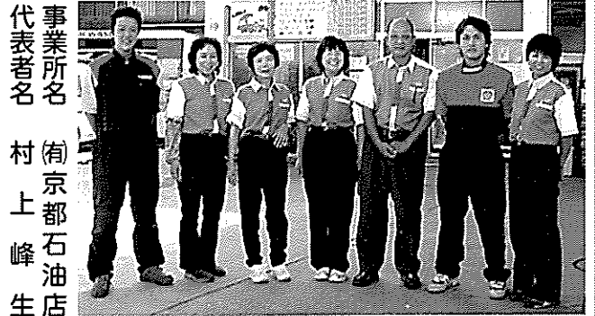
事業所名 (有)京都石油店 代表者名 村上峰生